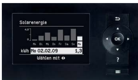
Die Vitotronic Regelung mit großem, mehrzeiligem Display ist grafikfähig und kann auch den Solarertrag anzeigen.