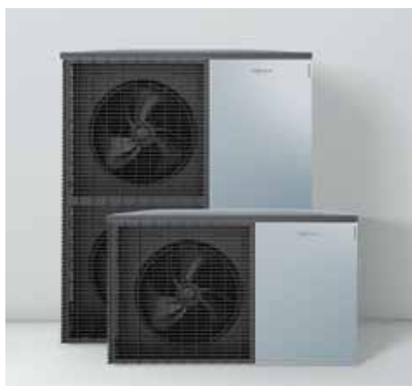
Buitenunits in Viessmann-design: Made in Germany