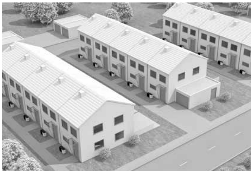
Bijzonder geruisloze werking, ideaal voor gebruik op locaties met rijhuizen

Via de Vitotronic 200-regeling kunt u de warmtepompen vanaf eender welke locatie via de onlinemodule Vitoconnect (toebehoren) en de gratis ViCare-app bedienen. En u kunt ze ook combineren met Vitovent centrale woningventilatietoestellen.